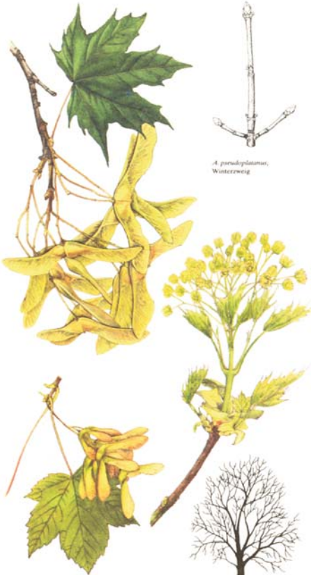
A. platanoides , Blatt und Fruchtstand