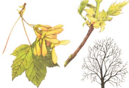
A. pseudoplatanus , Fruchtstand